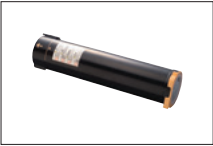
トナーカートリッジ

*:印刷可能枚数は目安です。印刷内容、用紙サイズ・種類、使用環境、1度に連続して印刷する頁数(起動／停止の頻度)などにより、実際の印刷可能枚数は大きく異なる場合があります。